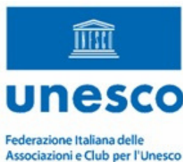
Club per l'UNESCO di Trapani