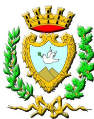
Comune di Erice Città di Pace e per la Scienza