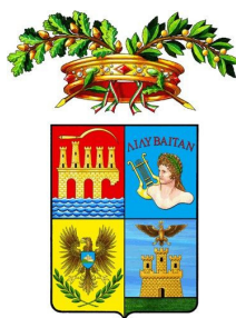
Libero Consorzio Comunale di Trapani