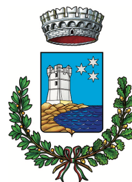
Comune di Valderice